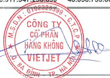
Nguyễn Thị Phương Thảo Tổng Giám đốc Ngày 31 tháng 8 năm 2020

Các thuyết minh từ trang 11 đến trang 70 là một phần cấu thành báo cáo tài chính hợp nhất giữa niên độ này.